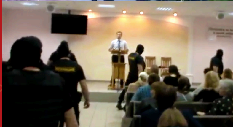
ОМОН срывает богослужение в Орле