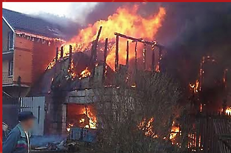
Поджог дома в Луцино

В России проживает свыше 175 тыс. активных Свидетелей Иеговы, а их богослужения посещает более 290 тыс. человек